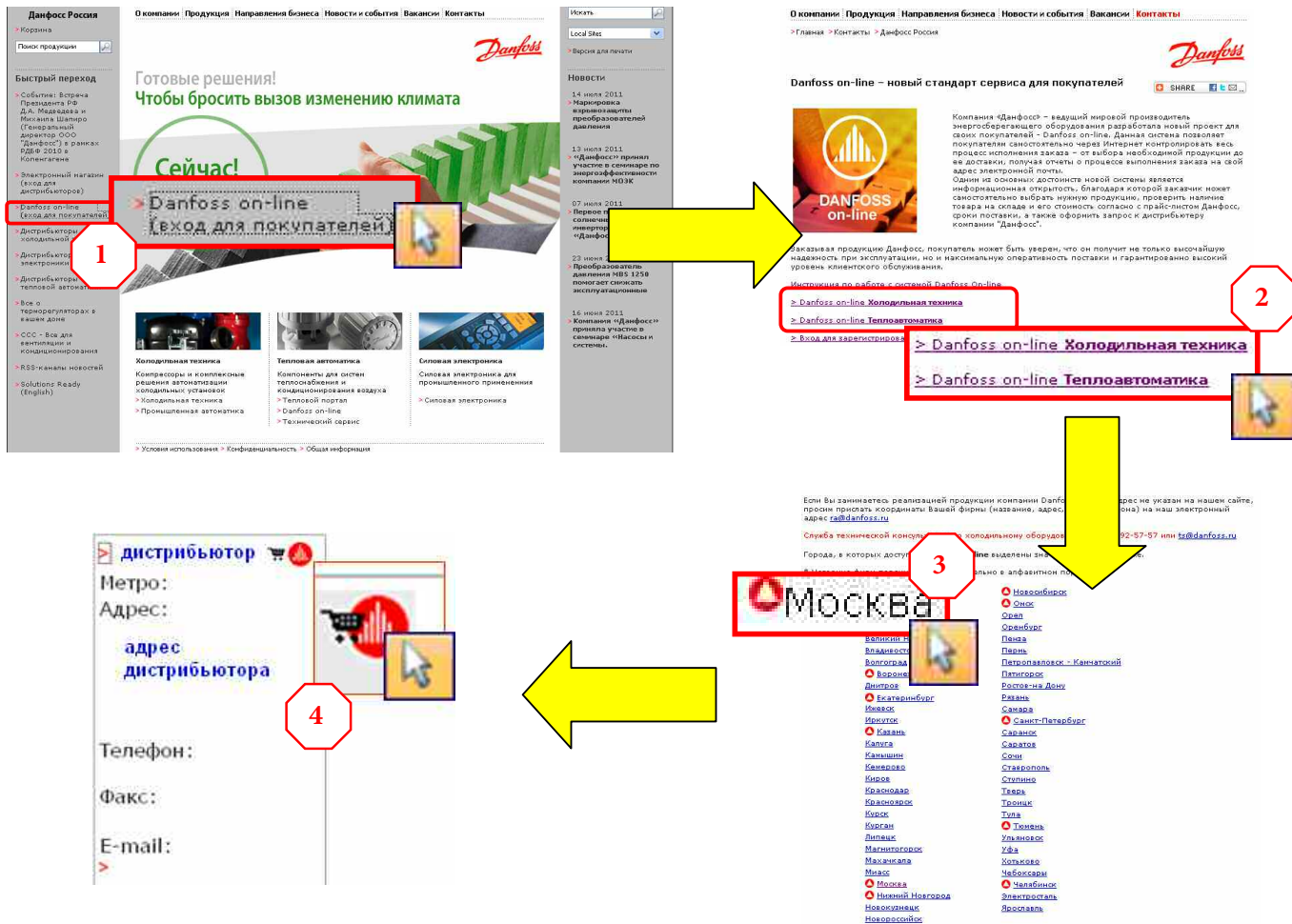
Рис. 1. Выбор дистрибьютора в DOL

1. На сайте www.danfoss.com/russia перейдите по ссылке «Danfoss Online» (вход для покупателей) (1). Выберите тип оборудования, который Вас интересует (2). Выберите город (3) и дистрибьютора, с которым хотите сотрудничать. Кликните на красно-белом кружочке (логотипе Danfoss Online) рядом с наименованием дистрибьютора (4). Вы попадете на страницу заказа оборудования.