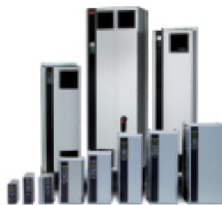
O amplo range de drives AKD 102 da Danfoss

Nosso AKD 102 possui uma função "Pack Controller" standard que controla um compressor com velocidade variável e dois fixos. Este recurso elimina o uso de controlador externo, reduzindo tempo e custos de instalação.