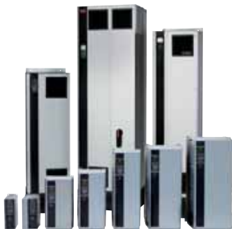
VLT® HVAC Drive

– todo lo que necesita, está ya integrado