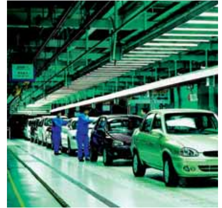
Shanghai General Motors, China