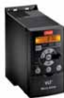
VLT® Micro Drive FC51