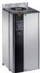
Panel IP 20 para VLT® HVAC Drive