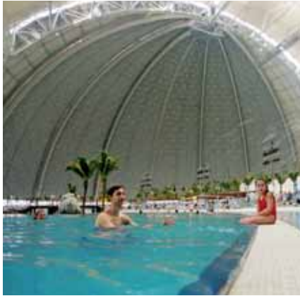
Tropical Islands Resort, cerca de Berlín, Alemania

Del proveedor de convertidores de frecuencia HVAC líder en el mundo