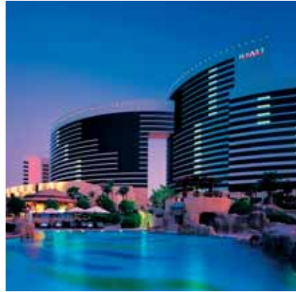
Grand Hyatt, Dubai