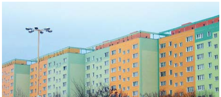
Рис. 1. Вид зданий после термомодернизации