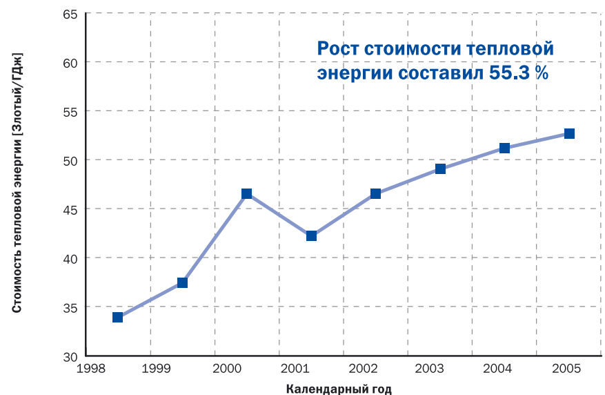
Рис. 2. Результаты энергосбережения по программе термомодернизации зданий г. Щецина в сопоставлении со стоимостью тепловой энергии (4 польских злотых = 1 евро)