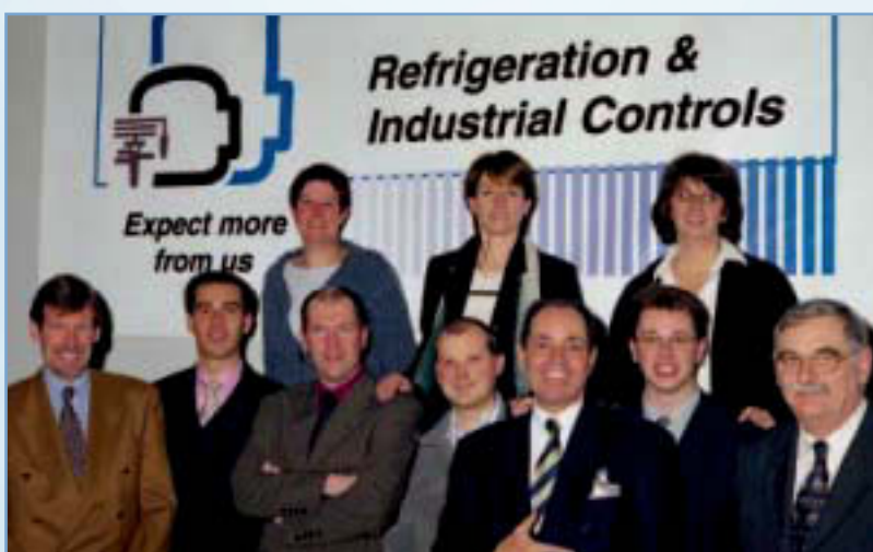
Rem.: Koen De Visscher n'est pas sur la photo.

Dans une précédente édition du présent bulletin d'information, nous vous avons expliqué comment disposer 24h/24h de la documentation Danfoss la plus récente via notre site web www.danfoss.be . Ce service électronique a été conçu à votre avantage, mais est parfois considéré comme impersonnel. Etant donné que Danfoss juge extrêmement importants l'approche et le service personnalisés, nous avons opté pour une structure d'organisation avec des bureaux de vente locaux. Aujourd'hui, Danfoss compte des bureaux de vente et des centres de service dans plus de 100 pays et un réseau mondial de distributeurs. Aucun de nos concurrents n'offre un service du même niveau. L'organisation Danfoss est unique !