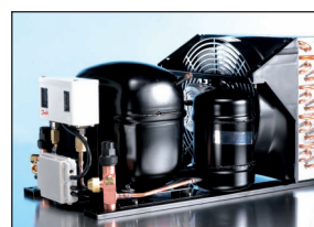
OPTYMA™ A04 versies