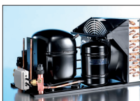
OPTYMA™ A01 versies