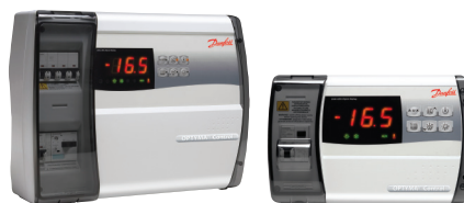
The family of OPTYMA™ Controls

De OPTYMA™ Control is bijzonder geschikt voor de OPTYMA™ en OPTYMA PLUS™ koelgroepen van Danfoss, maar is ook geschikt voor toepassing met andere merken koelgroepen die op de markt zijn. De regelaar kenmerkt zich door een aantrekkelijk ontwerp en een eenvoudige en flexibele programmering. Het biedt zowel de regeling, als de beveiliging in één behuizing, dankzij de unieke ingebouwde thermische magneetschakelaar, die veiligheid garandeert bij het uitschakelen van de voedingsspanning.