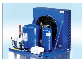
OPTYMA™ A02 versies