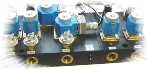
Modulares Ventilblocksystem ..... für Kfz-Zapfsäulen