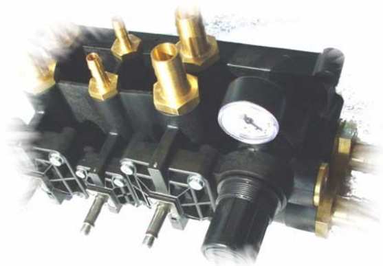
..... Auslassventil für Trinkwasserspender