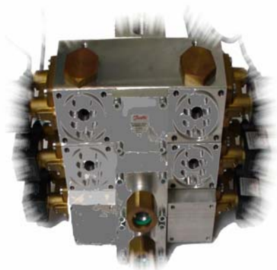
..... Steuerungsblock für Verdichteranlagen von Kühlanlagen