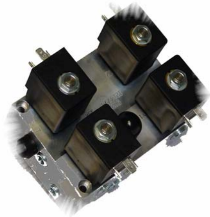
Ventilblock ..... für Steuerung des Kühlkreislaufes an Kunststoffspritzmaschinen